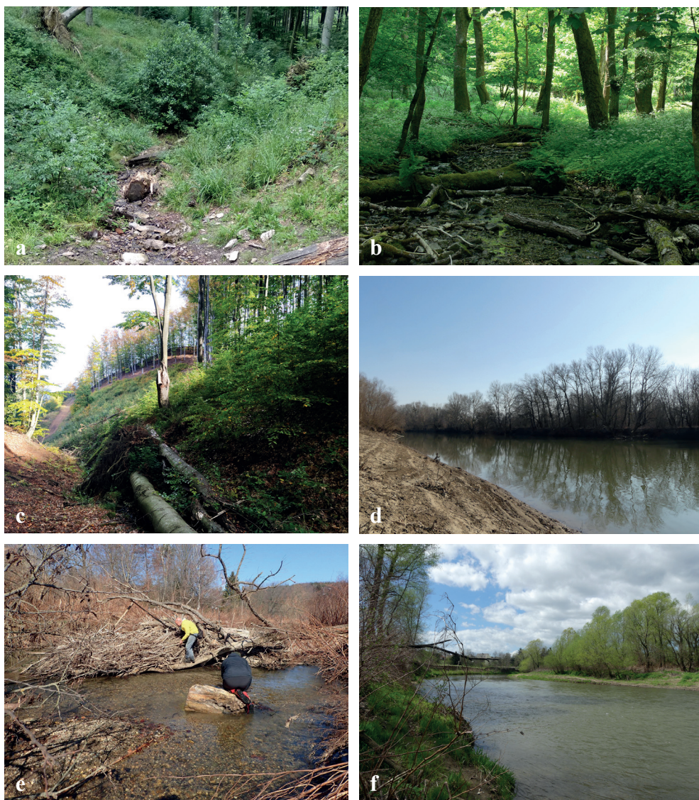
Fig. 3. Habitats: a = Kőszeg: Hétforrás patakja, photo: 13.06.2018 – Amphinemura standfussi, Nemoura marginata, Leuctra handlirschi, L. nigra, L. prima, Isoperla tripartita ; b = Szögliget: Ménes-patak, photo: 20.05.2015 – Isoperla sudetica ; c = Mátraszentimre: Szuhai-patak, photo: 05.10.2022 – Brachyptera seticornis, Nemoura cambrica, N. marginata, N. sciurus, Protonemura aestiva, Leuctra digitata, L. nigra, Diura bicaudata, Siphonoperla neglecta ; d = Felsőberecki, Bodrog, photo: 18.03.2022 – Taeniopteryx nebulosa, Isoptena serricornis ; e = Kőszeg: Gyöngyös, photo: 11.03.2022 – Brachyptera risi, Taeniopteryx schoenemundi, Zwicknia acuta, Perla marginata ; f = Magyarlak: Rába, photo: 13.04.2018 – Brachyptera risi, Perla marginata, Besdolus ventralis, Perlodes dispar