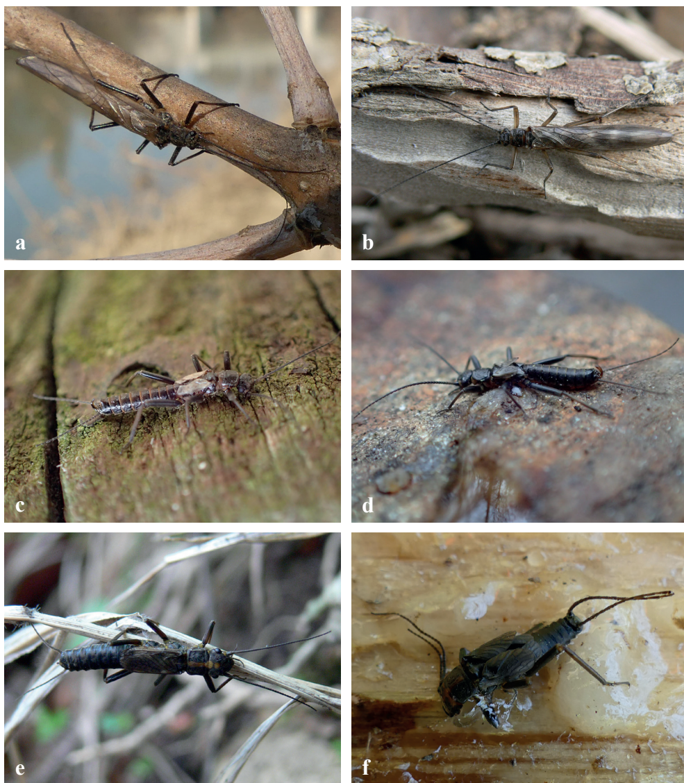
Fig. 2. Species: a = Taeniopteryx nebulosa , Sáros-patak: Bodrog; b = Rhabdiopteryx hamulata , Gyöngyössolyos: Monostor-patak; c = Zwicknia acuta , Sopron: Rák-patak; d = Z. rupprechtii , Harka: Ház-hegy-árok; e = Diura bicaudata , Mátraszentimre: Szuhai-patak; f = Perlodes dispar (stuck in Pinus sylvestris resin), Felsőcsatár: Pinka