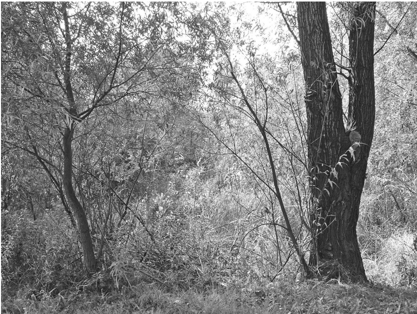
2. fotó. Gyraulus riparius (Westerlund, 1865) élőhelye: Karcsa, Vásártér a faluszél és a Nagy-Karcsa közötti erdőben, mocsaras gyékényes terület.

azért is érdekes, mert egy látszólag indifferens területen sikerült megtalálni, feltételezhetően a faj legnagyobb hazai állományát. Ennek ténye azt sugallja, hogy az egykori Karcsát kísérő süllyedékekerületek maradvány-mocsarainak kutatása további malakofaunisztikai meglepetésekkel szolgálhatnak. A faj a Bodrogzug belső területén is előkerült (3. fotó). Ennek alapján feltételezhetjük, hogy a Bodrogköz lecsapolása előtt a faj itt általánosan elterjedt lehetett.