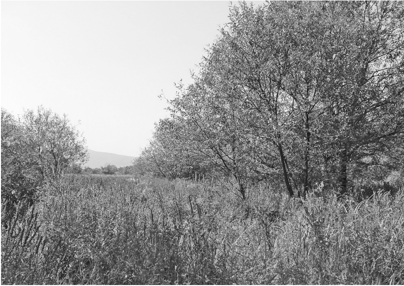
3. fotó. Gyraulus riparius (Westerlund, 1865) élőhelye: Bodrogkeresztúr, Perjés-hát DK, a Longi-ér közelében.