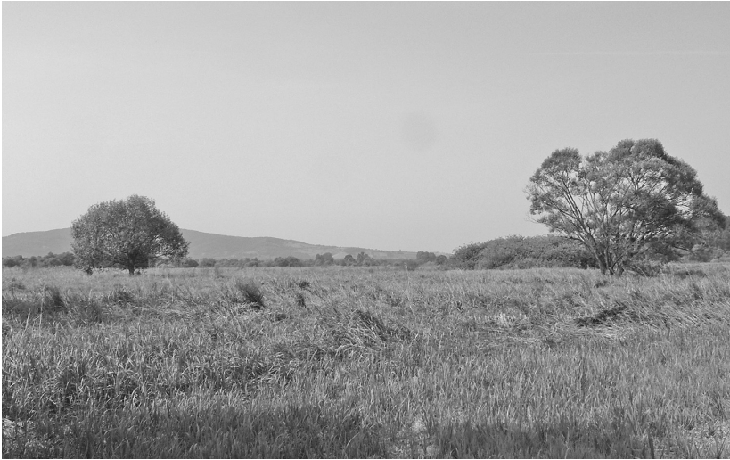
1. fotó. Valvata macrostoma Mörch, 1864 élőhelye: Bodrogkeresztúr, mocsárrét a Macskás-tótól DKK-re.

azért is érdekes, mert egy látszólag indifferens területen sikerült megtalálni, feltételezhetően a faj legnagyobb hazai állományát. Ennek ténye azt sugallja, hogy az egykori Karcsát kísérő süllyedékekerületek maradvány-mocsarainak kutatása további malakofaunisztikai meglepetésekkel szolgálhatnak. A faj a Bodrogzug belső területén is előkerült (3. fotó). Ennek alapján feltételezhetjük, hogy a Bodrogköz lecsapolása előtt a faj itt általánosan elterjedt lehetett.